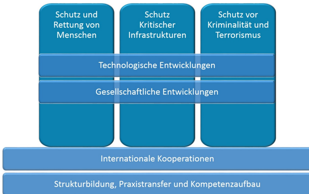
Abbildung 1: Programmsäulen und Querschnittsthemen des Rahmenprogramms „Forschung für die zivile Sicherheit 2018 – 2023“

Die Querschnittsthemen „Internationale Kooperationen“ sowie „Strukturbildung, Praxistransfer und Kompetenzaufbau“ befassen sich mit übergeordneten Fragestellungen der zivilen Sicherheitsforschung. So soll die zivile Sicherheitsforschung in Deutschland entlang der gesamten Innovationskette zukunftsfähig ausgestaltet und die Zusammenarbeit von Forschung, Wirtschaft und Anwendern auf europäischer und internationaler Ebene gestärkt werden.