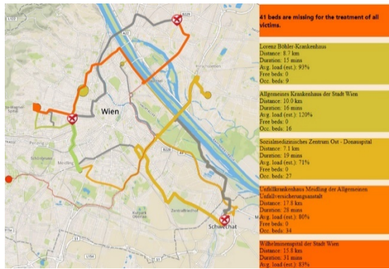
Abb. 3: Resilienz mehrerer Infrastrukturen visualisieren: Beispiel Krankenhäuser – jedes Krankenhaus bewertet und analysiert einzelne Szenarien mit Hilfe des SmartResilience Tools.

Plattform) frei zur Verfügung. Die Ergebnisse des Projekts fließen zudem in die Entwicklung eines neuen ISO-Standards ein (ISO 31050 „Guidance for managing emerging risks to enhance resilience“). Im Rahmen des Europäischen Clusters von Kritischen Infrastrukturen (ECSCI) leistet SmartResilience auch einen Beitrag bei der Neufassung der aktuell noch geltenden EU-Richtlinie 2008/114 über europäische kritische Infrastrukturen.